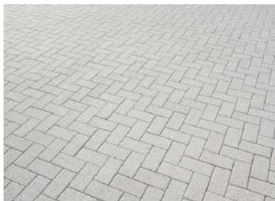
コンクリート舗装