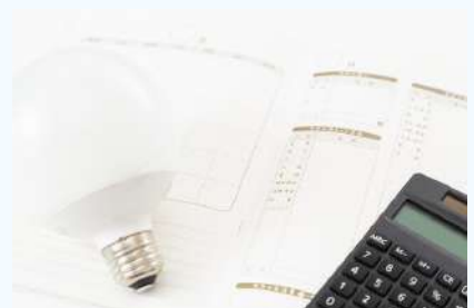
省エネ・コスト削減