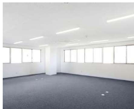
事務所・ガレージ・店舗など

倉庫の新築には、土地の取得や融資など、さまざまな手続きが必要となります。工場倉庫ドクターはこれらの手続きを代行することで、お客様のご負担を軽減します。